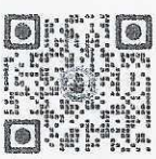
สิ่งที่ส่งมาด้วย ๑,๒,๓