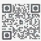
หนังสือนำส่ง