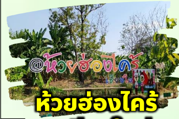
ห้วยฮ่องไคร้ จ.เชียงใหม่