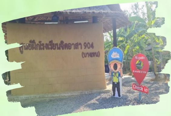
ห้องเรียนแปลง 1