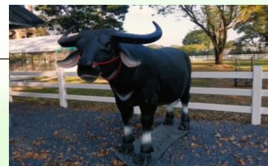
โครงการอนุรักษ์ และพัฒนากระบือไทย