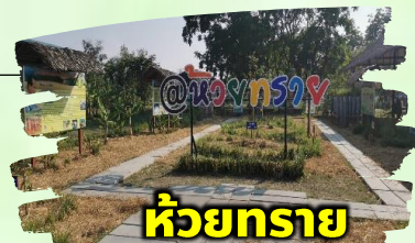
ห้วยทราย จ.เพชรบุรี