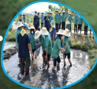
ฐานคนรักพระแม่โพสพ