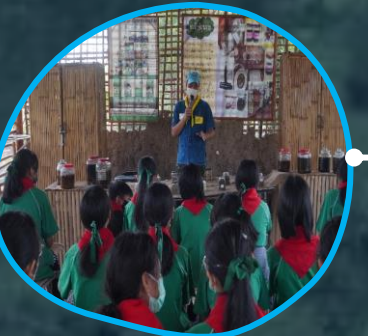
ฐานคนรักสุขภาพ