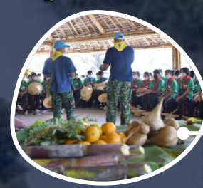
ฐานดำรงชีพในป่า