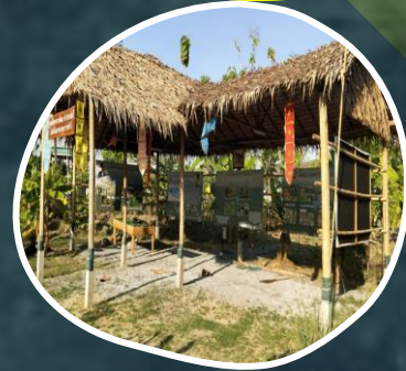
ห้วยฮ่องไคร้ จ.เชียงใหม่

6 ศูนย์ศึกษาการพัฒนาอันเนื่องมาจากพระราชดำริ