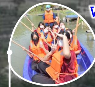
ฐานพายเรือ