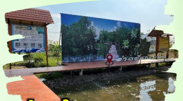
อ่าวคุ้งกระเบน จ.จันทบุรี