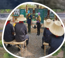
ห้องเรียนแปลง 3