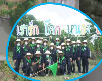
ป้าย เรารักโคกหนองนา