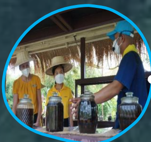
โชว์รูม แสดงผลิตภัณฑ์