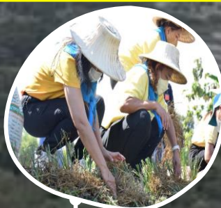
ฐานการพึ่งพาตนเอง คนรักชิป่า