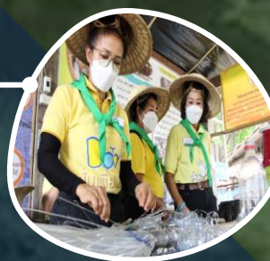
ฐานการแก้ปัญหา ขยะ