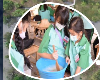
ฐานการพึ่งพาตนเอง คนมีน้ำยา