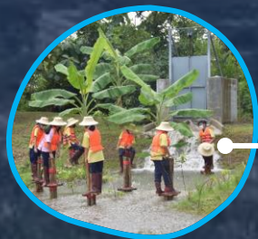
ฐานดินโคลนถล่ม

เข้า กิจกรรม ADVENTURE เรียนรู้การเอาตัวรอดใน สถานการณ์วิกฤต