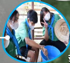
ฐานคนมีน้ำยา