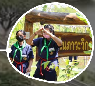
ฐานสื่อสารในสภาวะวิกฤต