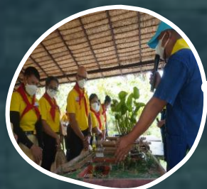
ฐานการแก้ปัญหา น้ำเสีย