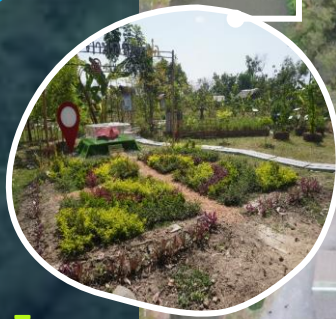
เขาสินช่อน จ.ฉะเชิงเทรา