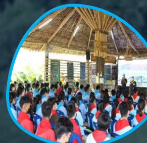
ห้องเรียนแปลง ที่ 1