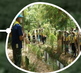
ฐานการแก้ปัญหา เข่าหัวโล้น