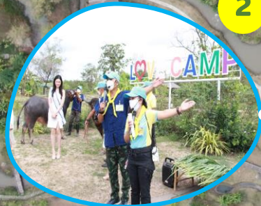
ป้าย Love Camp