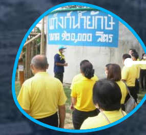
ฐานแท็งก์น้ำยักษ์