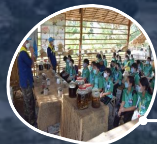
ฐานการพึ่งพาตนเอง คนรักสุขภาพ