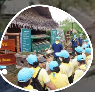
บ้านของเรา