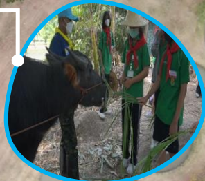
โครงการอนุรักษ์และพัฒนาระบบมือไทย