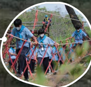
ฐานข้ามลำน้ำด้วยเชือก