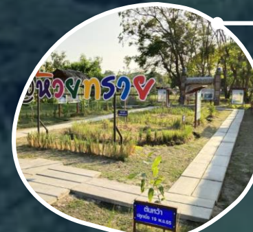
ห้วยทราย จ.เพชรบุรี