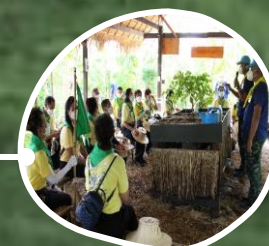
ฐานการแก้ปัญหา ดินเสีย