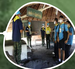
ฐานคนเอาถ่าน