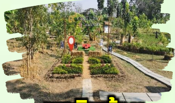
เขาสินช้อน จ.ฉะเชิงเทรา