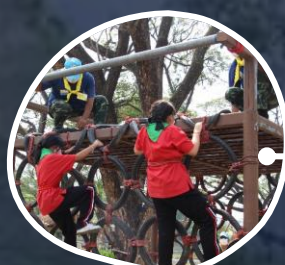
ฐานส่งกำลังแนวตั้ง