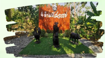
ภูพาน จ.สกลนคร