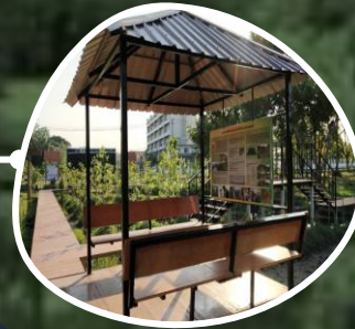
อ่าวคุ้งกระเบน จ.จันทบุรี