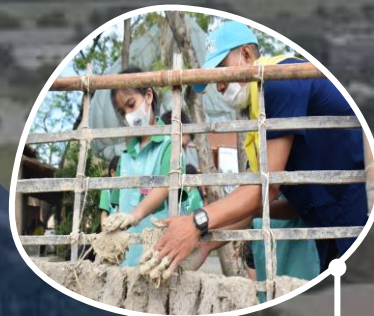
ฐานการพึ่งพาตนเอง คนติดดิน