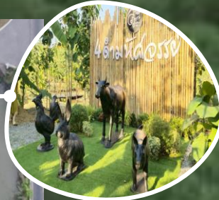
ภูพาน จ.สกลนคร