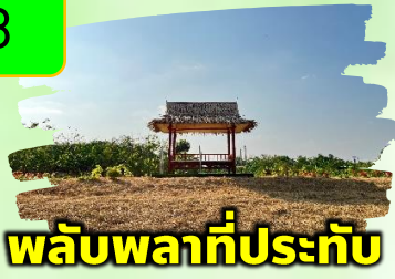
พลับพลาที่ประทับ