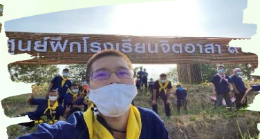
ป้ายไม้ไผ่ศูนย์ฝึกฯ