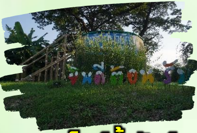
แท็งก์น้ำยักษ์