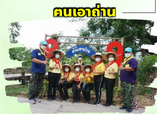
คนเอาถ่าน