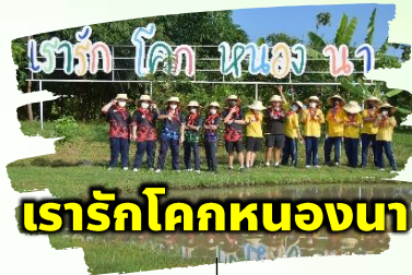
เรารัก โลก หนอง นา