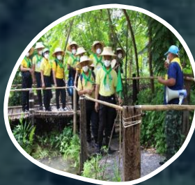
ฐานการแก้ปัญหา น้ำท่วม / น้ำแล้ง