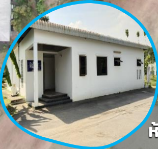
ห้องเรียนแปลงที่ 4