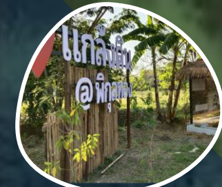
พิบูลทอง จ.นราธิวาส