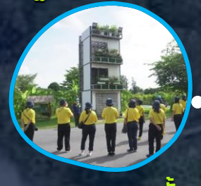
ฐานสวนแนวตั้ง