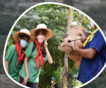
ฐานการพึ่งพาตนเอง โครงการอนุรักษ์ และ พัฒนาระบบมือไทย