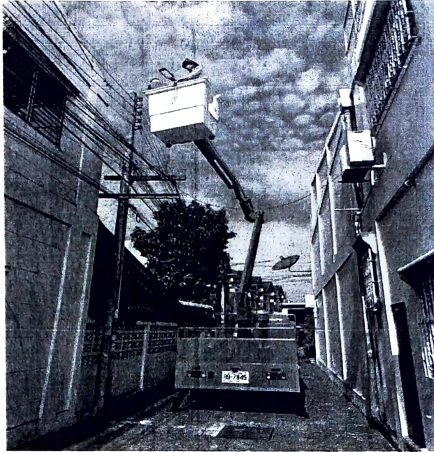
ภาพถ่ายขณะดำเนินการและดำเนินการแล้วเสร็จ